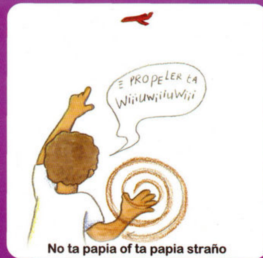
No ta papia of ta papia straño